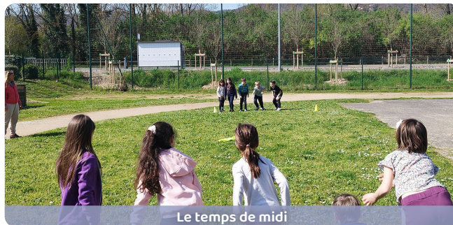
Le temps de midi

Ces séances sportives sont un vrai moment de plaisir , favorisant l'esprit d'équipe, la motricité et le bien-être des enfants après ou avant un bon repas !