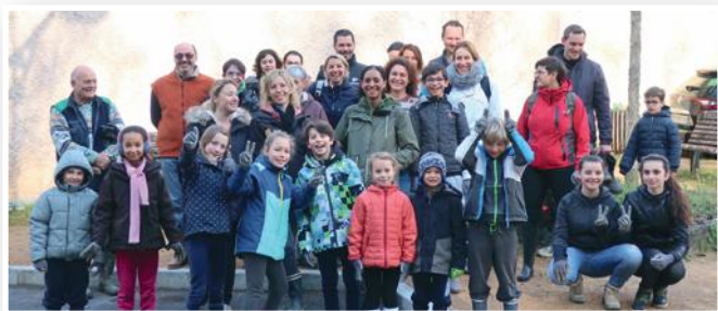
Participants nettoyage du ruisseau

Toutes ces actions sont entièrement financées par la Métropole de Lyon dans le cadre des Projets Nature. Le nettoyage du ruisseau : une action citoyenne bisannuelle du CIVRE.