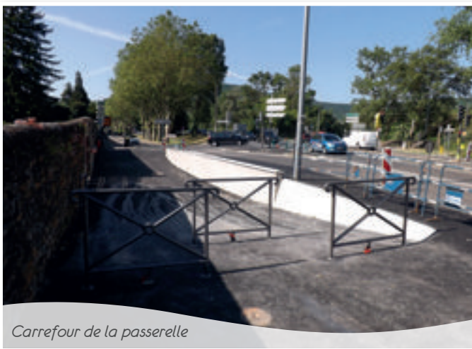
Carrefour de la passerelle

Deux Velux seront changés en raison de fuites importantes au niveau des boiserries. Les 5 volets de la salle Fernand Lacroix côté place très dégradés seront changés et le service technique repeindra le reste des boiserries du bâtiment.