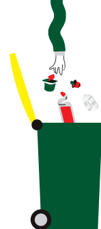
EN VRAC DANS LE BAC DE TRI, LES EMBALLAGES ET PAPIERS